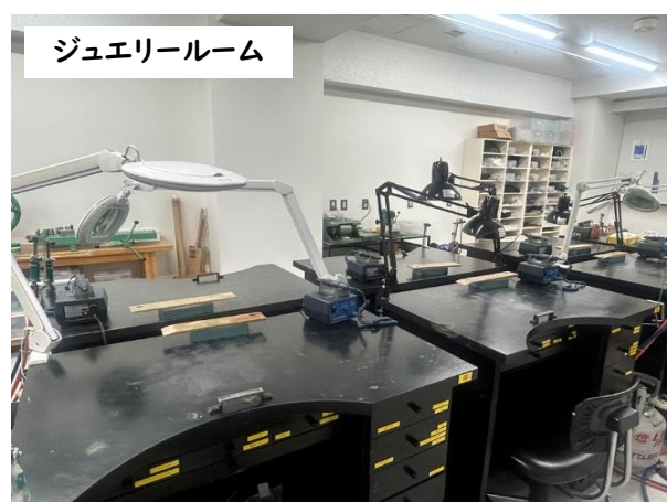
ジュエリールーム